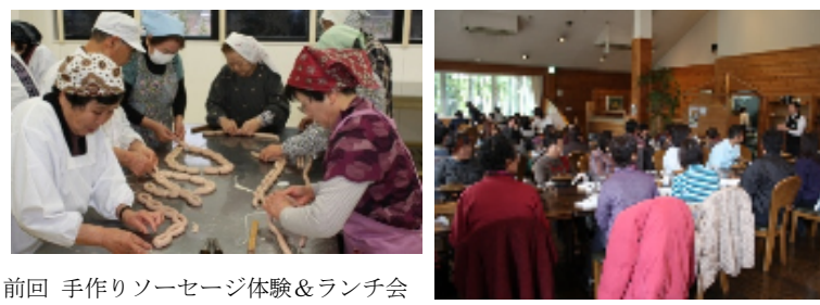
前回 手作りソーセージ体験&ランチ会